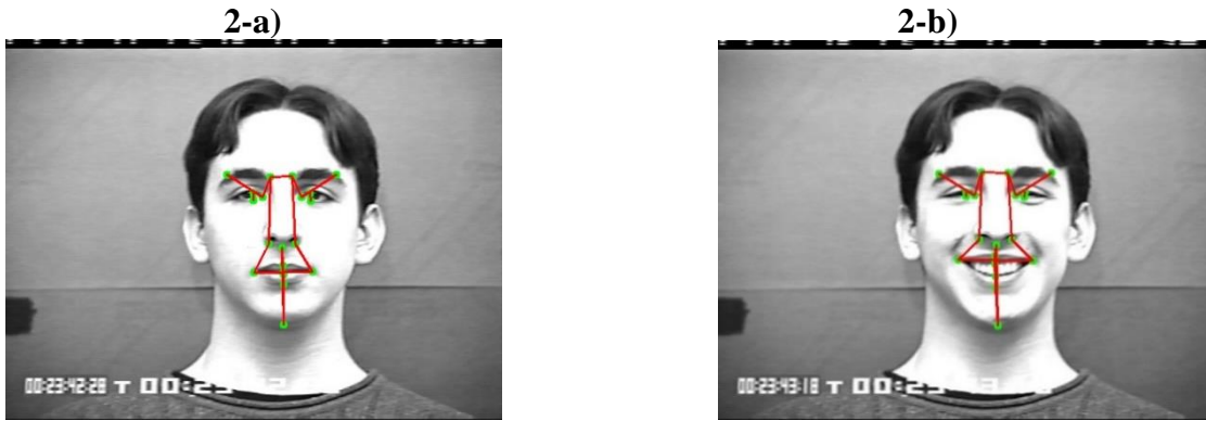
Figura 2-a: Disposição de AUs durante a expressão “Neutra”. (Autor, 2021). Figura 2-b: Disposição de AUs durante o ápice expressão “Felicidade” (Autor, 2021).